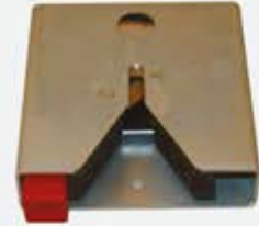
Kilit - ES 100-07 Lock - ES 100-07