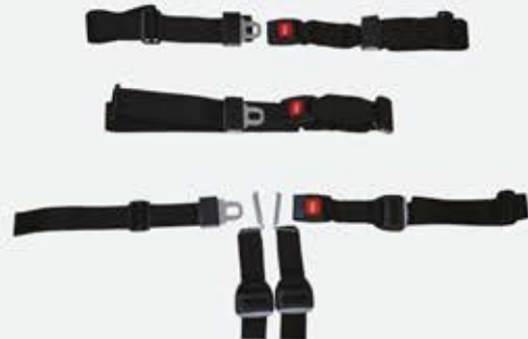
Emniyet Kemeri - ES 100-03 Safety Belt - ES 100-03