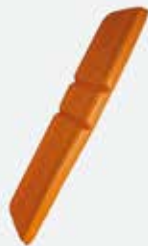
Presli (Yapıştırılmalı) Minder - ES 130 Pressed Mattress - ES-130