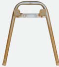
Ön tutucu - ES 100-06 Front Holder - ES 100-06