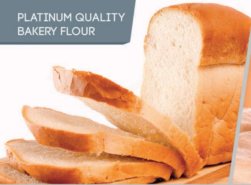
PLATINUM QUALITY BAKERY FLOUR