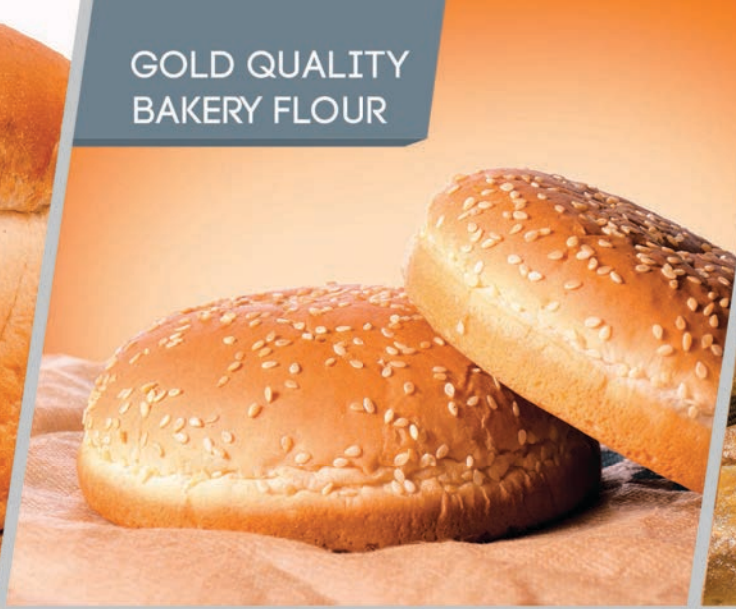
GOLD QUALITY BAKERY FLOUR