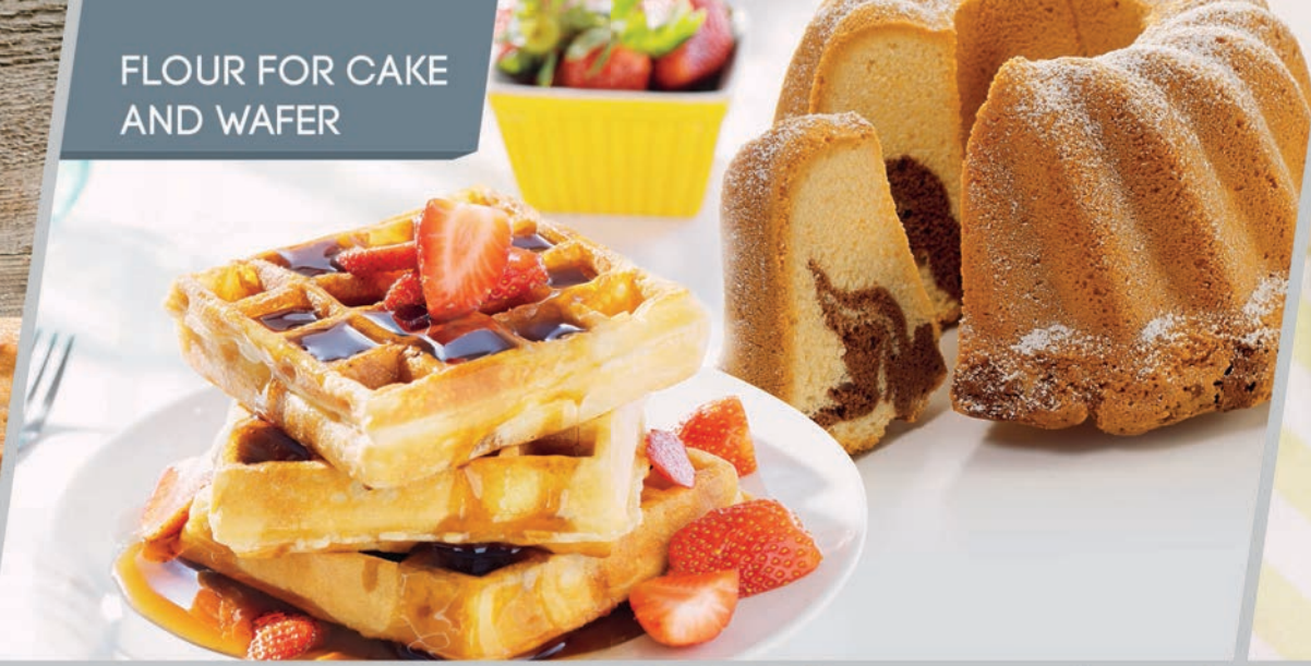
FLOUR FOR CAKE AND WAFER