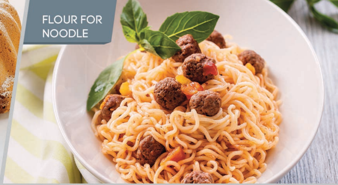
FLOUR FOR NOODLE