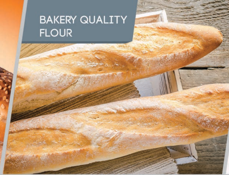
BAKERY QUALITY FLOUR