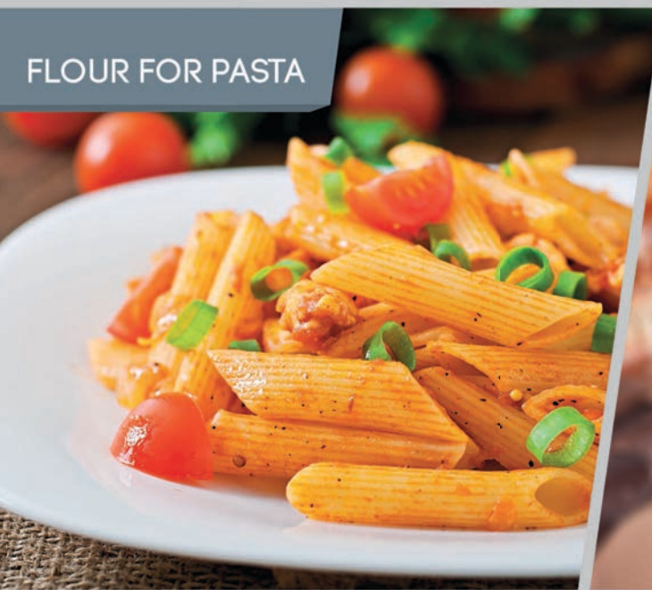
FLOUR FOR PASTA