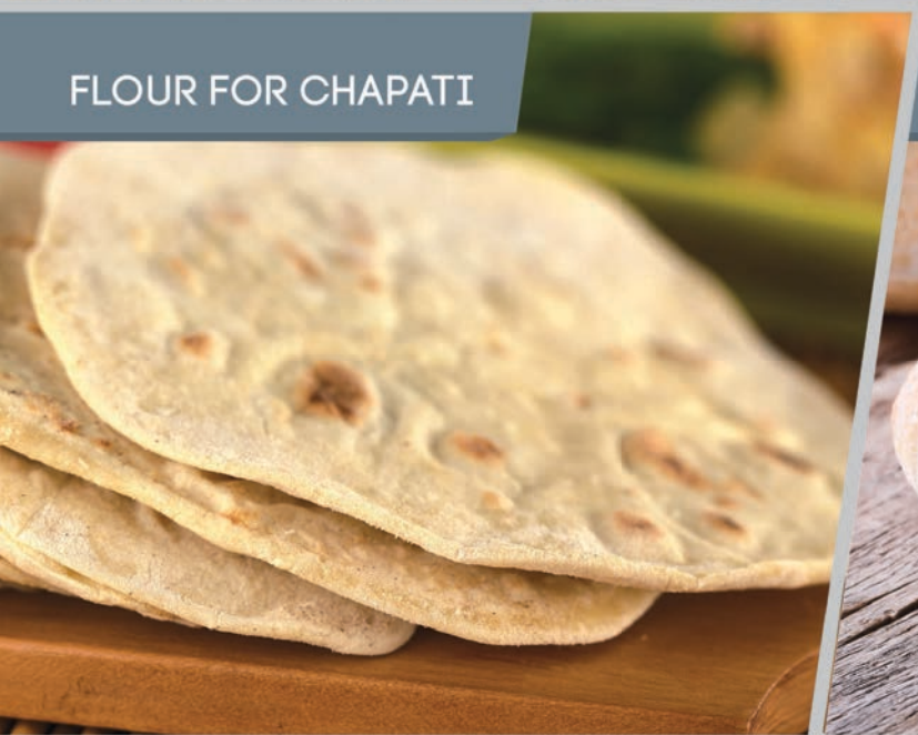
FLOUR FOR CHAPATI