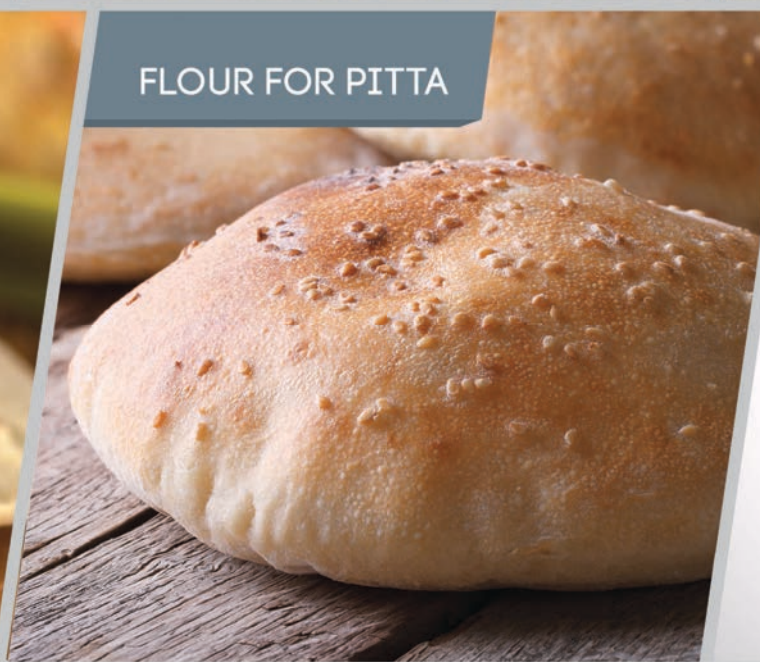
FLOUR FOR PITTA