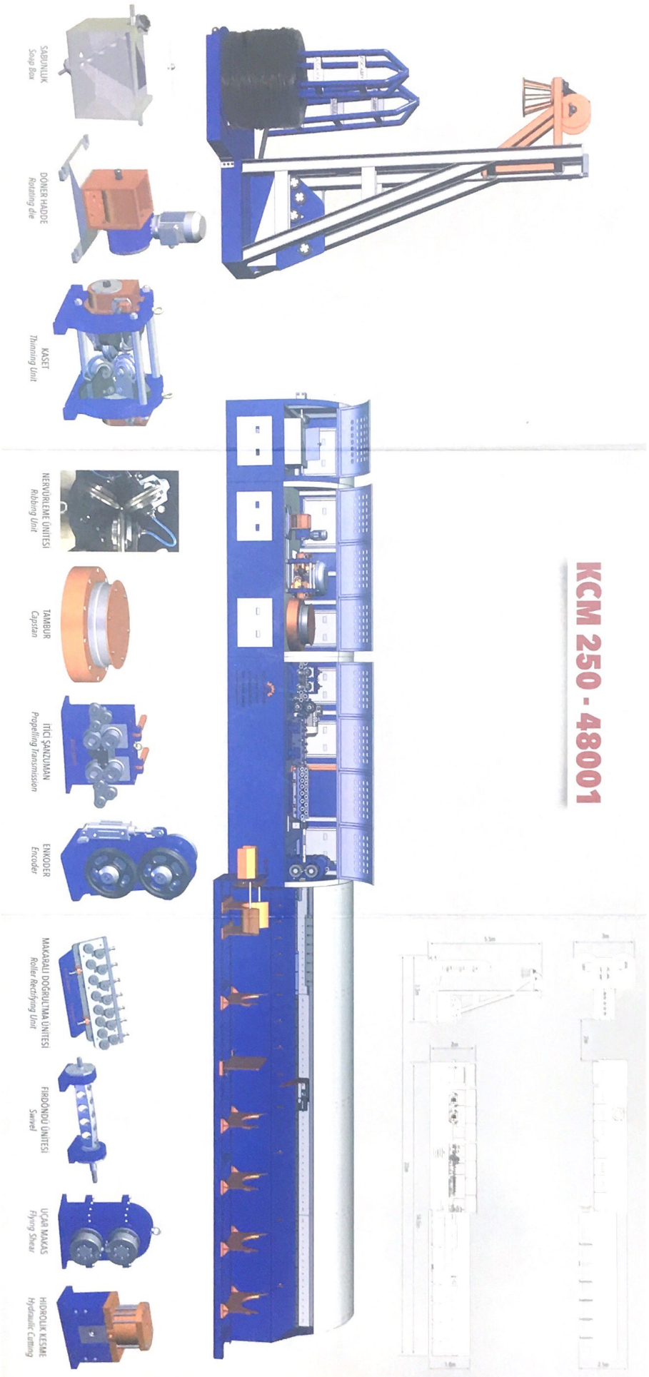
SABUNLUK Soap Blau