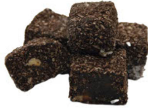
KASKASLI KAKAOLU DÖKME FINDIKLI LOKUM