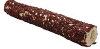
ZEREKŞİ KAPLAMALI DUBLE BEYAZ ÇİKOLATALI SULTAN FİTİL LOKUM