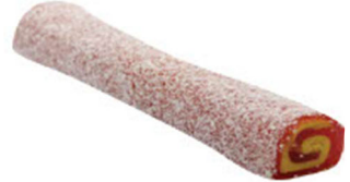
ÇİLEKLİ-MUZLU SULTAN FİTİL LOKUM