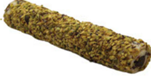
ANTEP FISTIĞI KAPLAMALI DUBLE SİYAH ÇİKOLATALI SULTAN FİTİL LOKUM