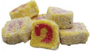
MUZLU-ÇİLEKLİ SULTAN SARMA LOKUM