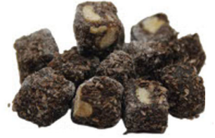
KASKASLI KAKAOLU DÖKME FINDIKLI LOKUM (MİNİ)