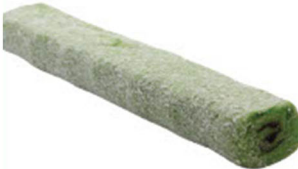
ELMALI SÜRME ÇİKOLATALI SULTAN FİTİL LOKUM