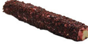
ZEREKŞİ KAPLAMALI DUBLE BEYAZ ÇİKOLATALI NARLI SULTAN FİTİL LOKUM