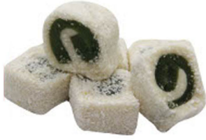
ELMALI-SÜTLÜ SULTAN SARMA LOKUM