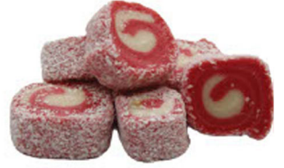
ÇİLEKLİ-SÜTLÜ SULTAN SARMA LOKUM