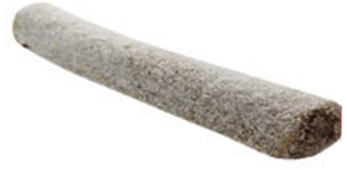
HİNDİSTAN CEVİZLİ PESTİL FİTİL LOKUM