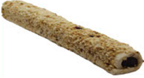
FINDIK KAPLAMALI DUBLE SİYAH ÇİKOLATALI SULTAN FİTİL LOKUM