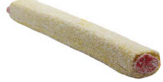
MUZLU-ÇİLEKLİ SULTAN FİTİL LOKUM