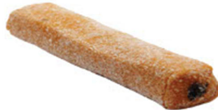
PORTAKALLI SÜRME ÇİKOLATALI SULTAN FİTİL LOKUM