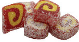
ÇİLEKLİ-MUZLU SULTAN SARMA LOKUM