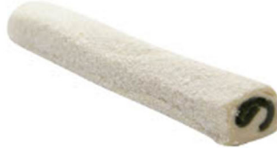
SÜTLÜ-ELMALI SULTAN FİTİL LOKUM