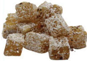
HİNDİSTAN CEVİZLİ SADE DÖKME FINDIKLI LOKUM