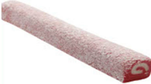
ÇİLEKLİ-SÜTLÜ SULTAN FİTİL LOKUM