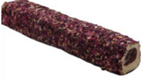
GÜL KAPLAMALI NARLI YUVARLAMA SULTAN FİTİL LOKUM