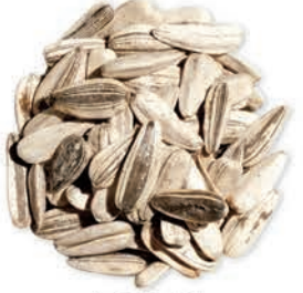
Ay Çekirdeği Sunflower Seeds بذور دوار الشمس