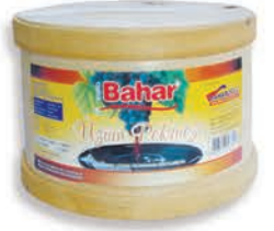
Katı Külek Pekmezi Solid Grape Molasses ديس العنب المركز