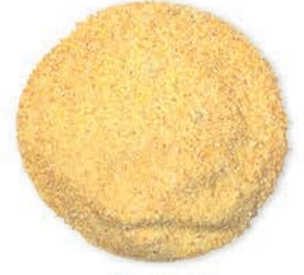
Mısır İrmigi Corn Semolina سميد الذرة