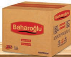
50 x 20 Adet Kuruluk Kolisi