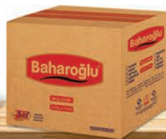
2,5 Kg x 7 Adet