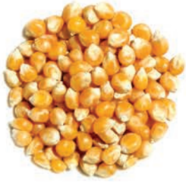
Patlatmalık Mısır Corn الذرة