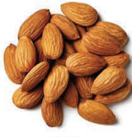
Badem Almond لوز