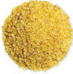
Midyat Orta Bulgur Medium Bulgur برغل وسط