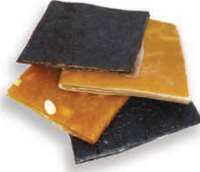
Üzüm Pestili Dried grape pulp لب العنب المجفف