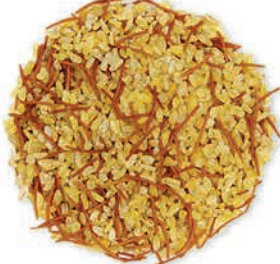
Şehriyeli Pilavlık Bulgur Coarse Vermicelli برغل خشن بالشعيرية