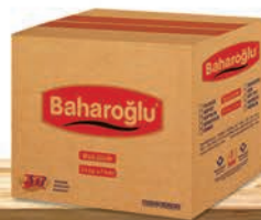
5 Kg x 5 Adet