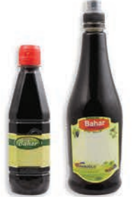
Nar Pekmezi Pomegranate Syrup ديس الرمان