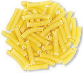
İnce Kesme Thin Cutting الاصابع الرقيقة