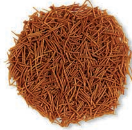
Kavrulmuş Tel Şehriye Roasted Vermicelli شعيرية محمصّة