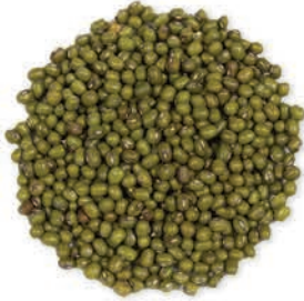
Maş Mung اللوبیاء الشعاعیة (الماش)