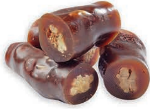
Cevizli üzüm sucuğu Grape molasses coated nuts حلويات سق العنب بالجوز