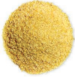
Sefer Kite (Ceris) Sefelkitel Jareesh Bulgur جریش ناعم