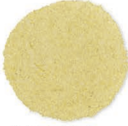
Buğday İrmigi 0 Numara Wheat Semolina # 0 سميد القمح نمرة (0)