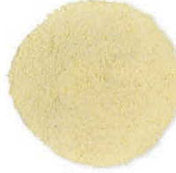
Mısır Unu Corn Flour طحين الذرة