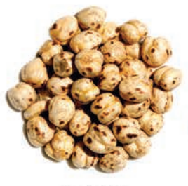
Sarı Leblebi Yellow Chickpeas قضامة صفراء