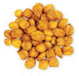
Soslu Mısır Corn With Sauce شيبس الذرة المحمصة