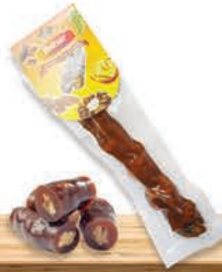
Tekli Vakumlu Sucuk