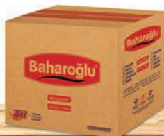
5 Kg x 5 Adet