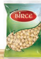
1 Kg (Birce Marka)