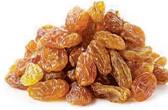
Kuru Üzüm Dried raisin عنب مجفف (الزبيب)