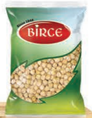
5 Kg (Birce Marka)