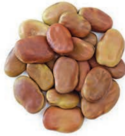
Bakla Broad Beans فول