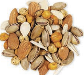
Kokteyl Çerez Mixed Nuts مكسرات مشكلة