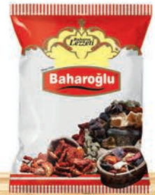
OPP Kuruluk Ambalaj