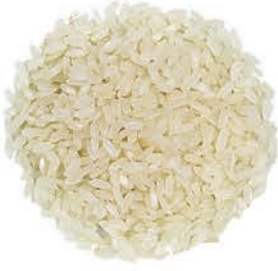
Baldo Pirinç Baldo Rice أرز بالدوي