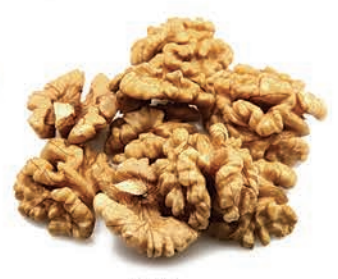
Ceviz Walnut جوز