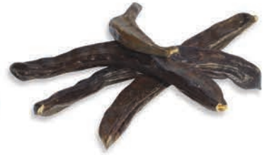
Keçiboynuzu Meyvesi Carob fruit ثمرة الخروب