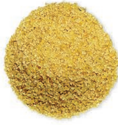
Köftelik Bulgur Fine Bulgur برغل ناعم