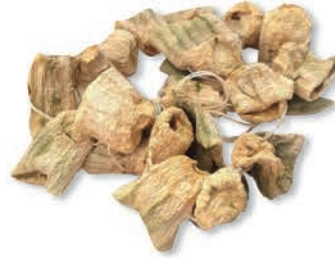
Dolmalık Kabak Dried zucchini for stuffing كوسا مجفف