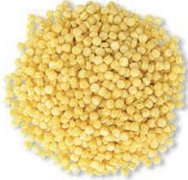
Kuskus Couscous الكسكس