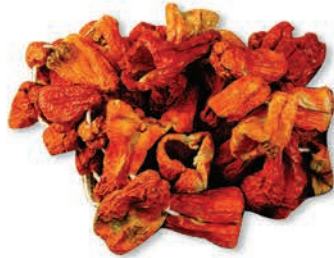
Dolmalık Biber Fried ball pepper for stuffing الفلفل المجفف