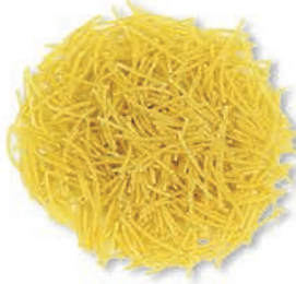
Tel Şehriye Vermicelli شعيرية