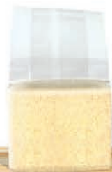
Vakumlu İrmik Ambalajı - Vacuum Semolina Packaging