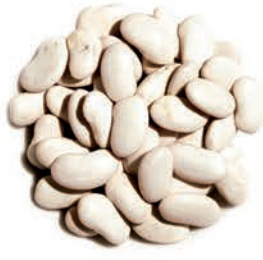
Kuru Fasulye White Beans فاصولیا