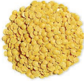
Sarı Mercimek Yellow Lentils عدس اصفر