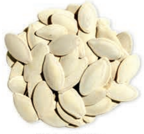
Kabak Çekirdeği Pumpkin Seeds بذور اليقطين (القرع)