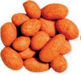
Soslu Çerez Nuts With Sauce شيبس الذرة المنكهة