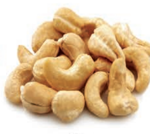
Kaju Cashew كاجو