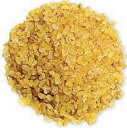
Pilavlık Bulgur Coarse Bulgur برغل خشن