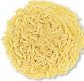
Arpa Şehriye Barley Noodle شعيرية لسان عصفور