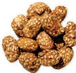
Şekerli Leblebi Sweet Chickpeas قضامة حلوة