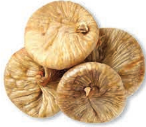
Kuru İncir Dried fig pulp تين مجفف