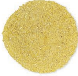
Buğday İrmigi 3 Numara Wheat Semolina # 3 سميد القمح نمرة (3)