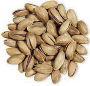
Antep Fıstığı Pistachio فستق عنتابی غیر مقشور