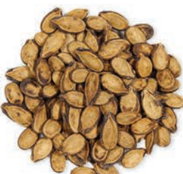
Karpuz Çekirdeği Watermelon Seeds بذور البطيخ