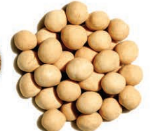
Çıtır Leblebi Crispy Chickpeas قضامة مقرمشة