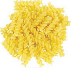
Burgu Bract الولبية