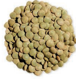
Yeşil Mercimek Green Lentils عدس اخضر