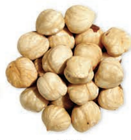
Fındık Hazelnut بندق