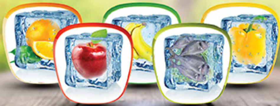
Soğuk Hava Deposu