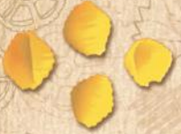
31 KÜÇÜK MİDYE (SMALL SHELLS)