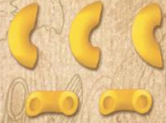
35 ÇİZGİSİZ DİRSEK (SMALL ELBOWS WITHOUT LINE)