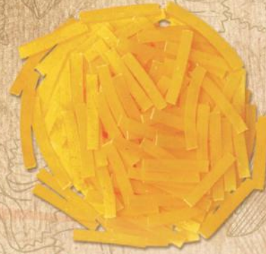
50 ERİŞTE (NOODLES)