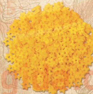
52 YILDIZ ŞEHRİYE (STARS)