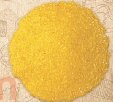
60 İRMİK (SEMOLINA)