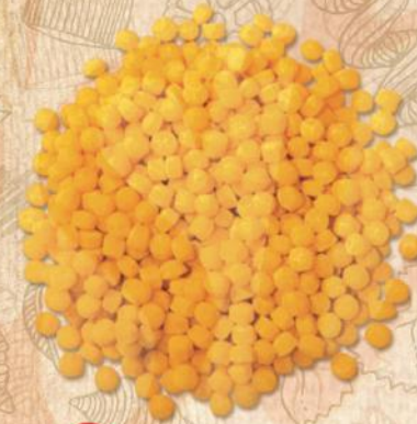
51 KUSKUS (COUSCOUS)