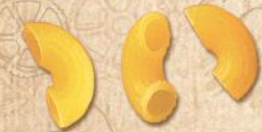
34 İNCE DİRSEK (SMALL ELBOWS WITH LINE)