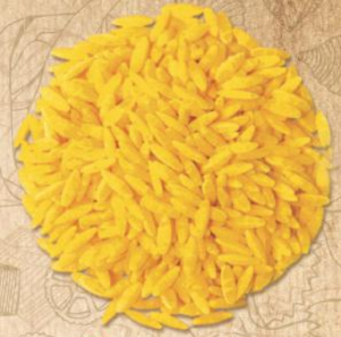
53 ARPA ŞEHRİYE (BARLEY)