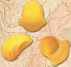
32 MANTI (LUMACHE LICLE)