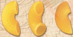
33 İRİ DİRSEK (BIG ELBOWS)