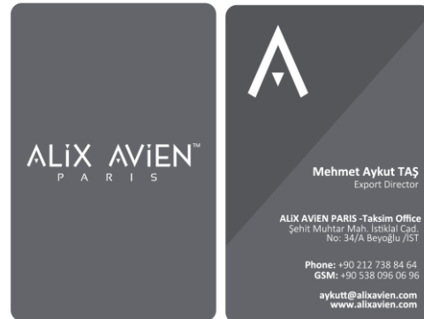
CARTE DE VISITE