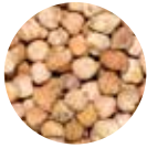
Nohut Risört Crumb Chickpeas