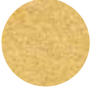
Köftelik Bulgur Fine Bulgur