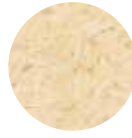
Basmati Pirinç Basmati Rice