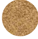
Köy Tipi Bulgur Special Village Type Bulgur