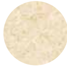
Osmancık Pirinç Osmancık Rice