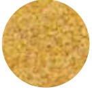
Pilavlık Bulgur Coarse Bulgur

FOOD AND NON-FOOD PARCELS SUPPLIED INTERNATIONAL AID ORGANIZATIONS