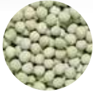
Yeşil Bezelye Green Peas