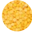
Sarı Mercimek Yellow Lentils