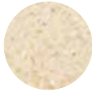
Trakya Baldo Pirinç Trakya Baldo Rice