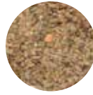
Mercimek Unu ve Kepeği Lentil Flour and Bran