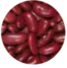
Kırmızı Fasulye Red Beans