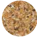
Bulgur Kırığı Broken Wheat