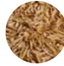
Çeltik Kavuzu Peddy Husk