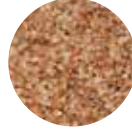
Esmer Orta Bulgur Brown Medium Coarse Bulgur