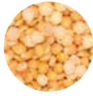
Sarı Kırık Bezelye Yellow Split Peas