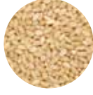
Aşurelik Buğday Pounded Wheat