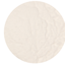
Pirinç Unu Rice Flour