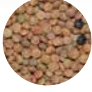
Kırmızı Kabuklu Mercimek Whole Red Lentils