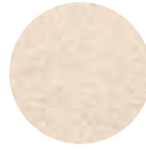
Pirinç Kepeği Rice Bran