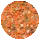
Mercimek Risört Crumb Lentils