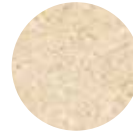
Kırık Pirinç Broken Rice