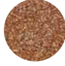
Esmer Pilavlık Bulgur Brown Coarse Bulgur