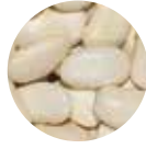
Bomba Fasulye Large Lima Beans