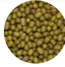
Maş Fasulye Green Mung Bean