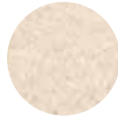
Pilavlık Pirinç Round Grain Rice