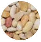
Fasulye Risört Crumb Beans