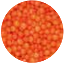
Kırmızı Futbol Mercimek Football Red Lentils