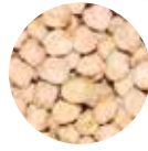
Tüylü Nohut Velvety Chickpeas