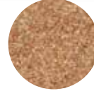
Esmer Köftelik Bulgur Brown Fine Bulgur