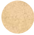
Bulgur Kepeği Wheat Bran