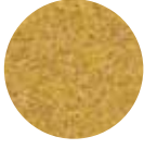
Orta(Midyat) Bulgur Medium Coarse Bulgur