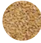
Baldo-Baş Bulgur Baldo Bulgur