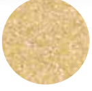
Safelkitel Jareesh Fine