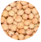
Sarı Tüm Bezelye Yellow Peas