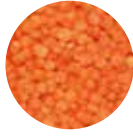
Kırmızı Yaprak Mercimek Split Red Lentils