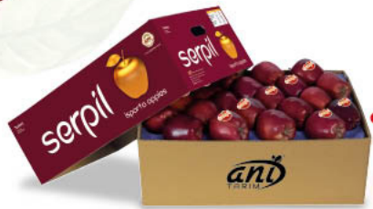
9 - 10 kg Open Top Box