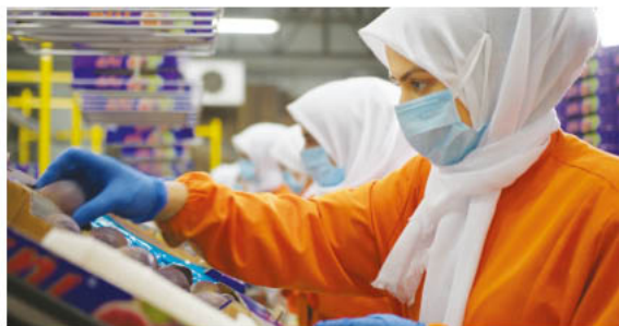
Ani Tarım Black Fig packing facility