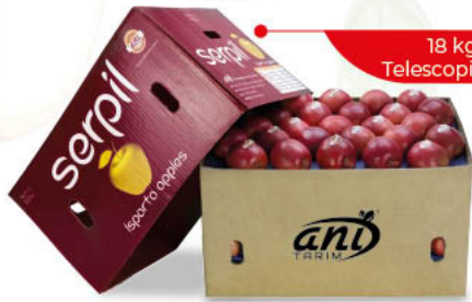
18 kg Telescopic Box