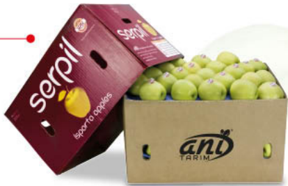
18 kg Telescopic Box