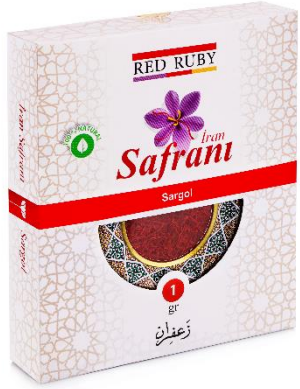
1 gr White ( Sargol )