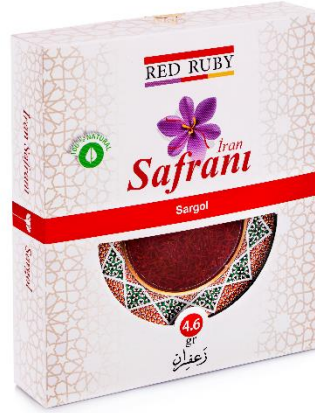
4.6 gr White ( Sargol )