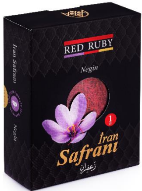
1 gr Black ( Negin )