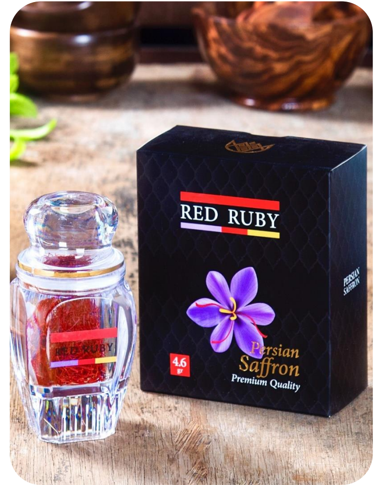
4.6 gr Black ( Negin )