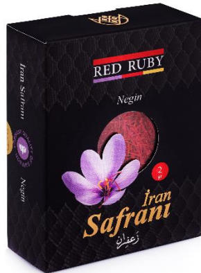
2 gr Black ( Negin )