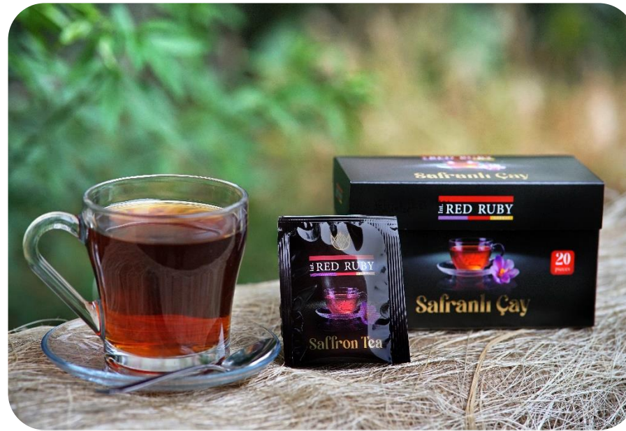
Té de azafrán